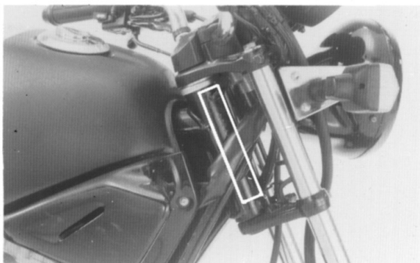
(1) O número de série do chassi está gravado no lado esquerdo do tubo da coluna de direção.