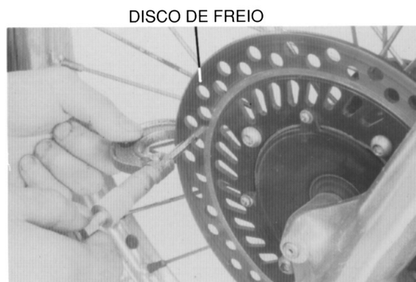
DISCO DE FREIO