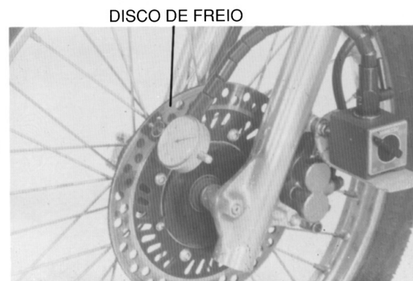
DISCO DE FREIO