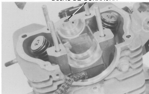
BUJÃO DE BORRACHA

Remova o bujão de borracha. Não o perca. Remova os pinos guias.