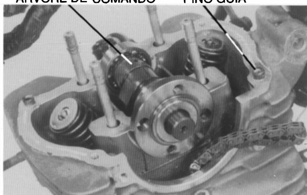
ÁRVORE DE COMANDO PINO GUIA

Remova o bujão de borracha. Não o perca. Remova os pinos guias.