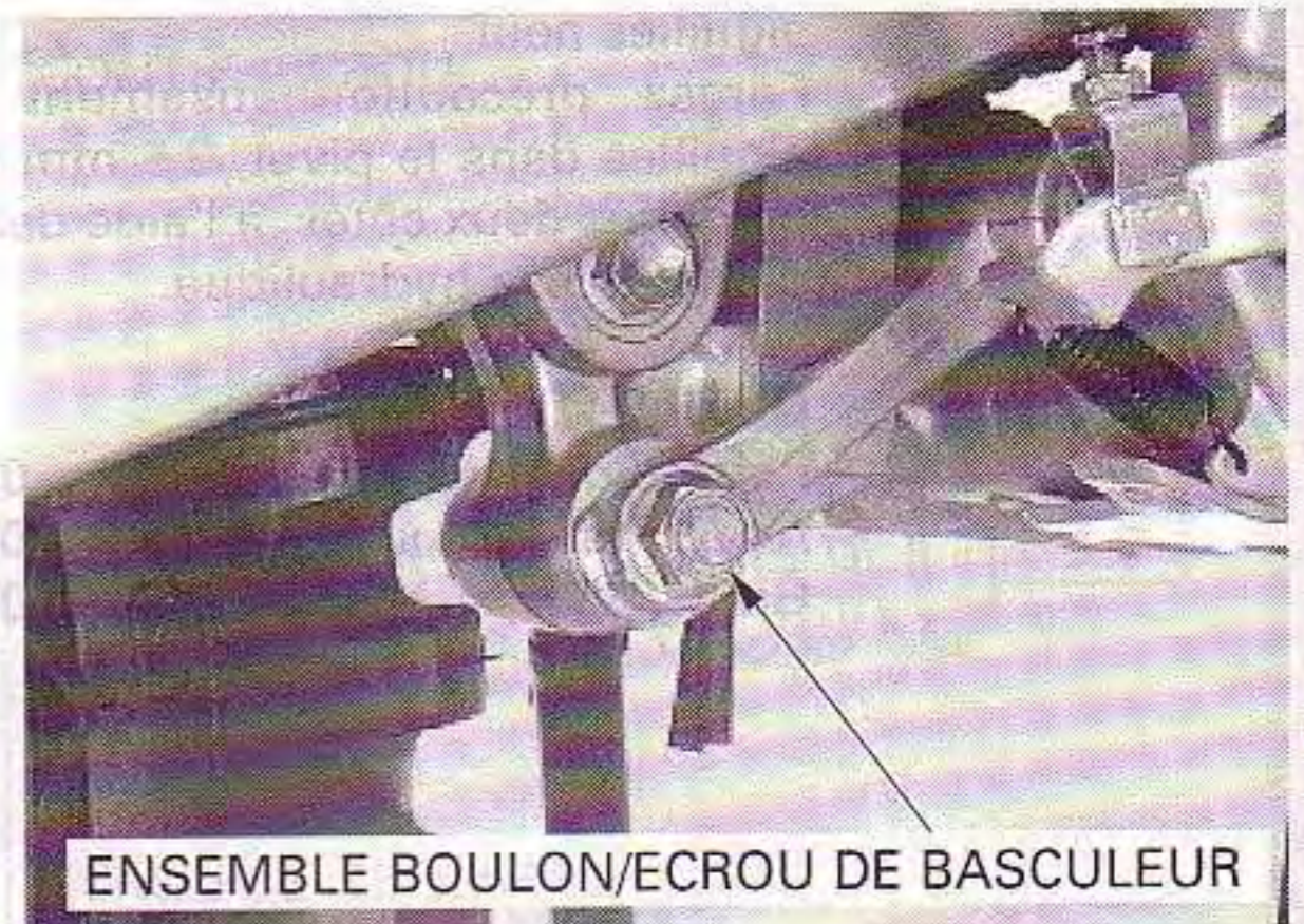
ENSEMBLE BOULON/ECROU DE BASCULEUR

Installez le berceau (page 2-7). Installez le siège (page 2-2).