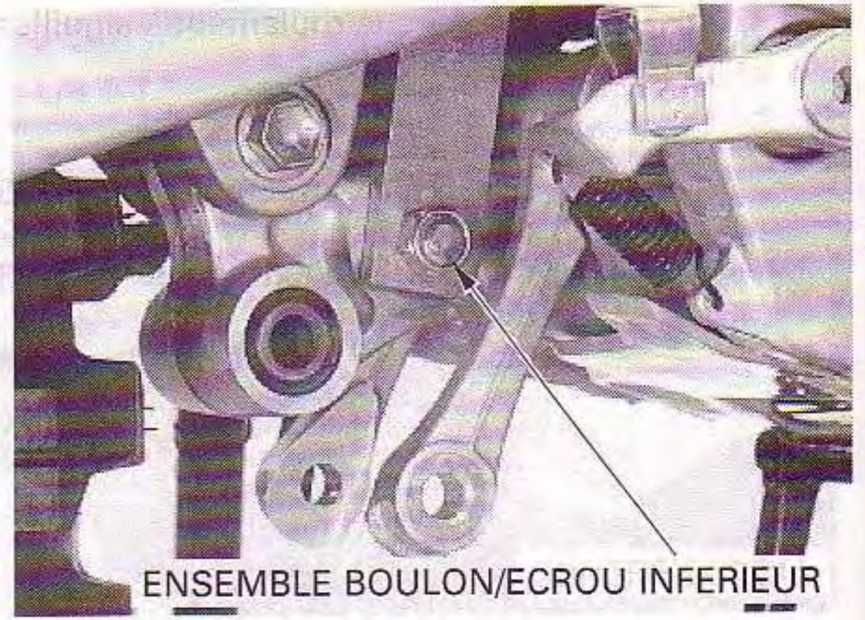
ENSEMBLE BOULON/ECROU INFERIEUR

Installez et serrez l'ensemble boulon/écrou entre la biellette et le basculeur.