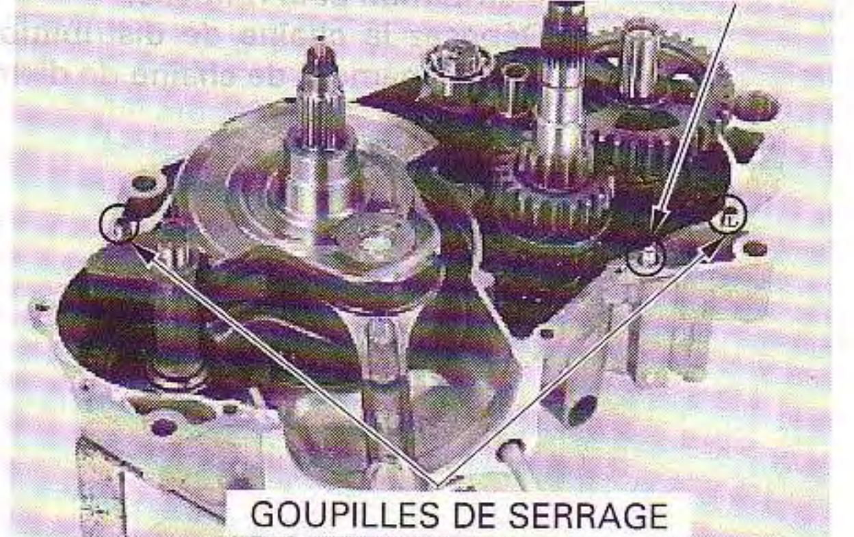
GOUPILLES DE SERRAGE