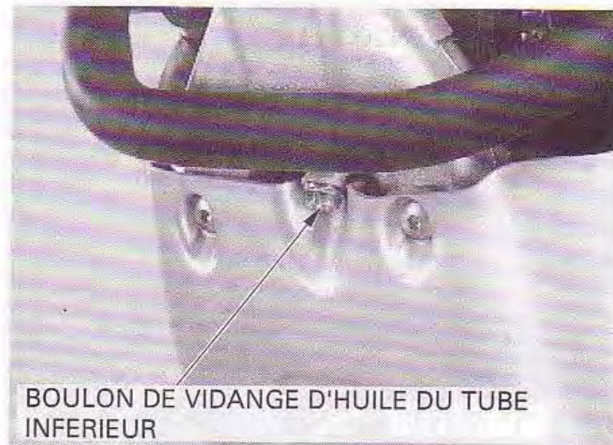
BOULON DE VIDANGE D'HUILE DU TUBE INFERIEUR