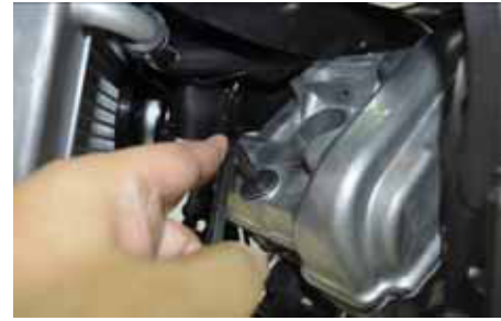
21. ใช้ประแจหกเหลี่ยม เบอร์ 6 ถอดโบลท์ยึดฝาครอบวาล์ว จำนวน 2 ตัว