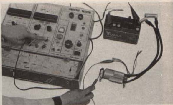
Fig. 3-99 Contrôle de l'état du condensateur

Contrôler la capacité du condensateur à l'aide d'un capacimètre. S'assurer également que l'isolateur de condensateur n'est pas brisé.