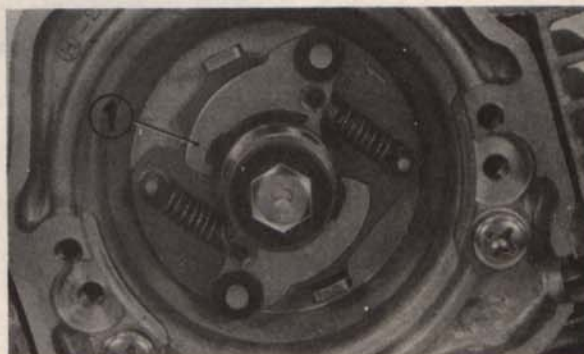
Fig. 3-102 (1) Dispositif d'avance à l'allumage