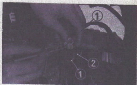
Fig. 4-90 (1) Conducteur vert clair/rouge (2) Contacteur de point mort