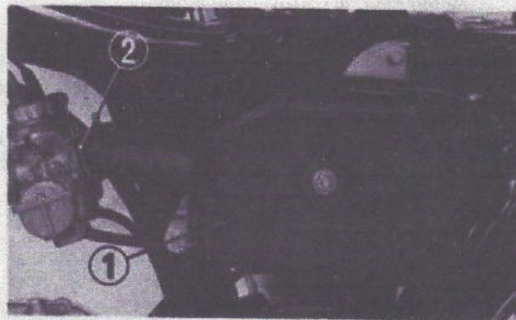
Fig. 4-73 (1) Filtre à air complet (2) Brides de fixation de conduit de filtre à air