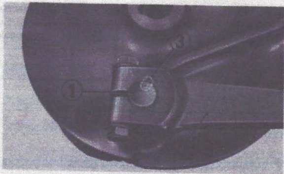
Fig. 4-60 (1) Came de commande de frein (2) Bras de commande de frein (3) Repère poinçonné