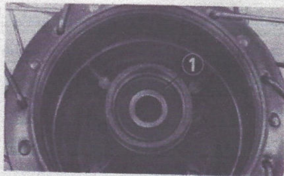
Fig. 4-59 (1) Côté fermé de roulement à billes