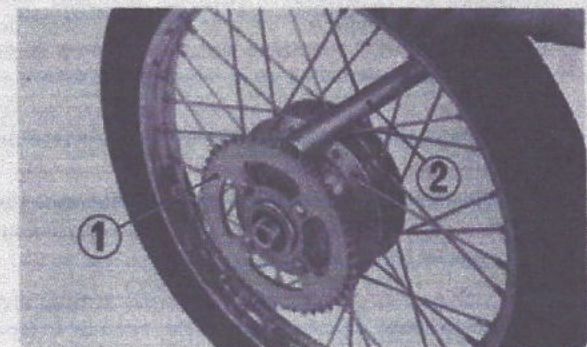
Fig. 4-56 (1) Pignon d'entraînement final (2) Tige de bois