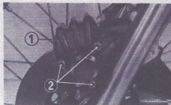
Fig. 4-13 (1) Carter de protection d'étrier (2) Boulon de 6mm