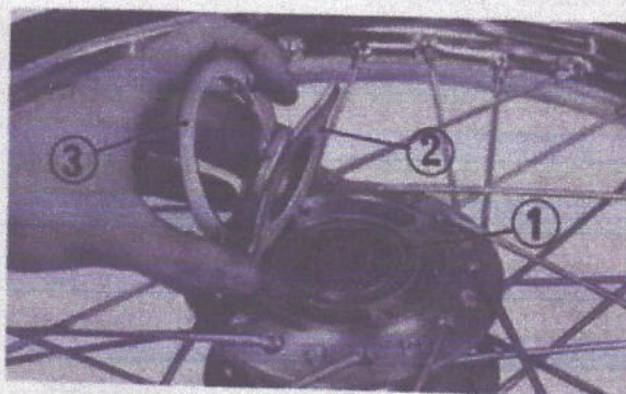
Fig. 4-9 (1) Joint torique (2) Porte-boîtier de boîtier de l'indicateur de vitesses (3) Couvercle du porte-boîtier