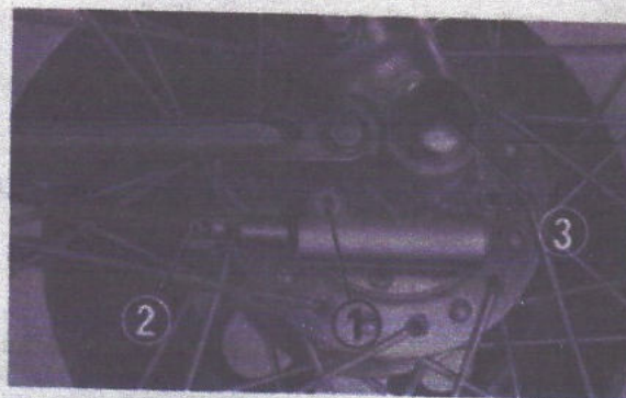
Fig. 4-2 (1) Vis de fixation (2) Câble de l'indicateur de vitesses (3) Axe de roue avant