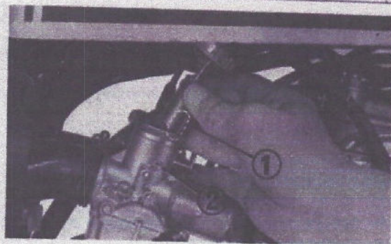
Fig. 3-78 (1) Gorge de clapet de commande des gaz (2) Partie concave