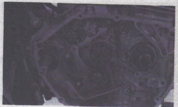
Fig. 3-53 (1) Bras de commande de tambour (2) Tambour sélecteur (3) Pivot de tambour