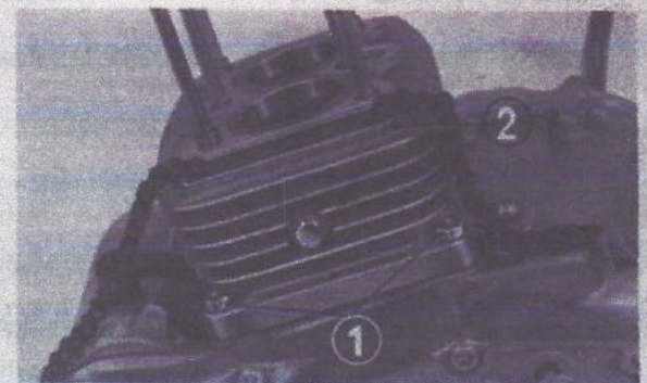
Fig. 3-20 (1) Ecrous de fixation de cylindre (2) Cylindre