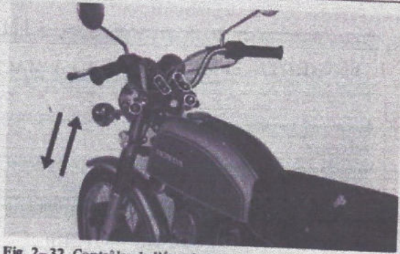
Fig. 2-32 Contrôler de l'état de la suspension avant