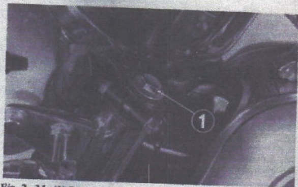
Fig. 2-34 (1) Bouchon de remplissage de fluide ATF