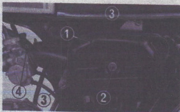
Fig. 2-22 (1) Boîtier de filtre à air (2) Ecou de fixation du boîtier (3) Boulon de montage de l'élément de filtre à air (4) Bride de fixation du conduit de raccordement