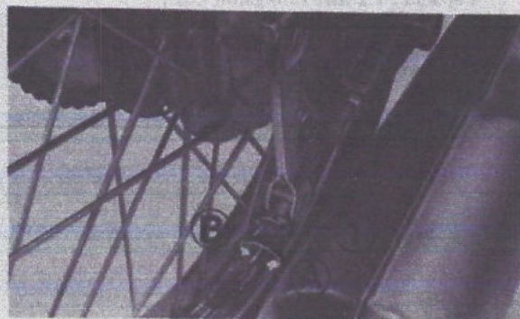
Fig. 2-21 (1) Ecou de réglage de frein arrière