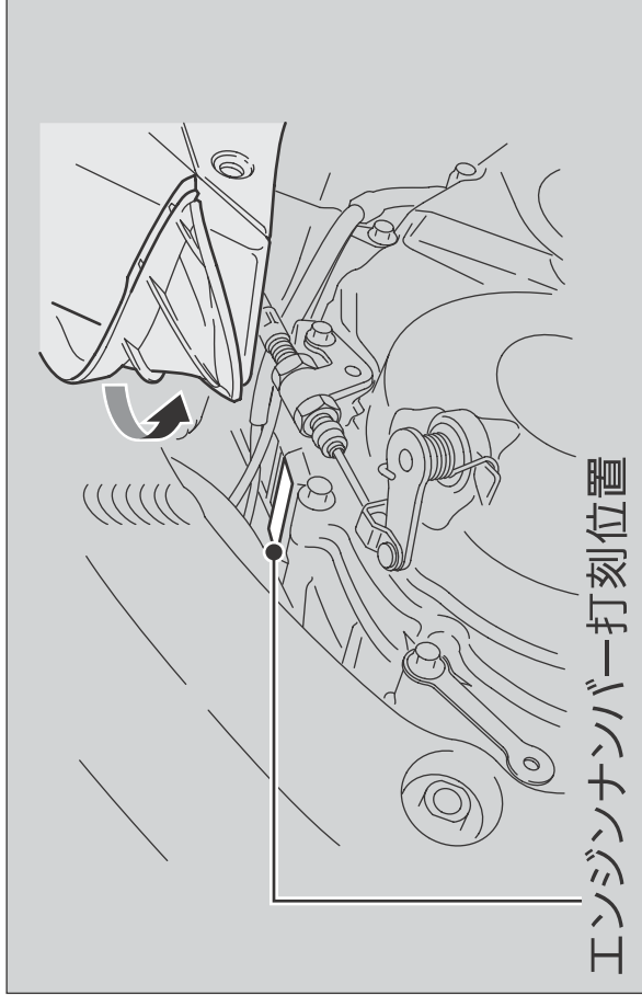
エンジンナンバー打刻位置