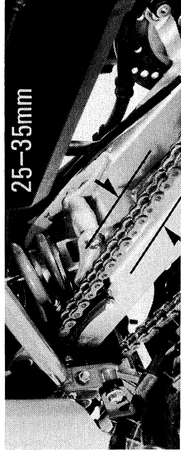
①ドライブチェーン