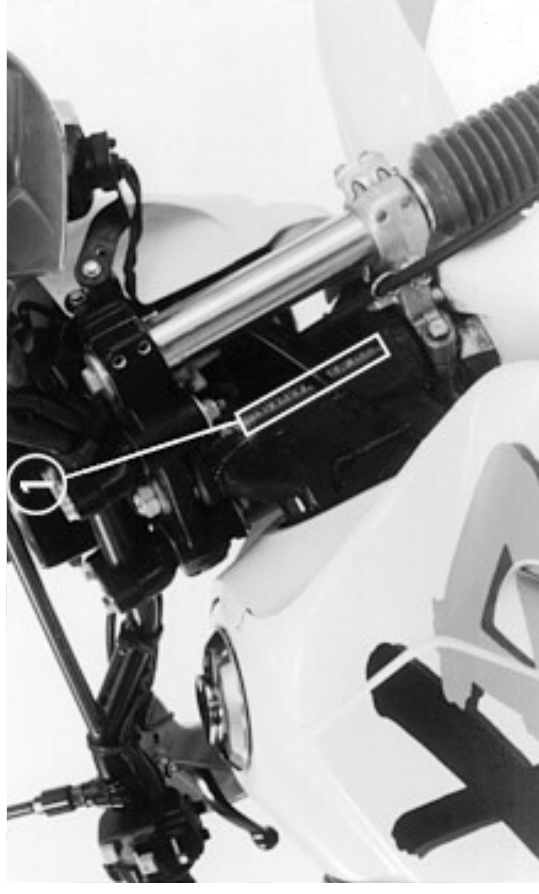
(1) Número do chassi