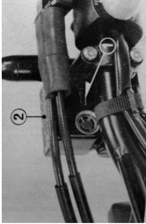
(1) Marca de nível inferior (2) Tampa do reservatório

Se o nível do fluido estiver próximo da marca inferior (1) do reservatório, remova a tampa (2) e o diafragma. Abasteça o reservatório com FLUIDO PARA FREIO MOBIL - Super heavy duty brake fluid, até atingir a marca de nível superior (3). Reinstale o diafragma e a tampa do reservatório, apertando os parafusos firmemente.