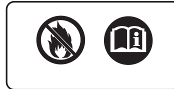
ETICHETTA DELL'AMMORTIZZATORE POSTERIORE