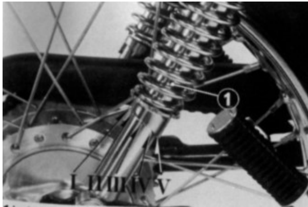
(1) Amortecedor traseiro

A posição I é recomendada para cargas leves e utilização em pistas de superfície uniforme.