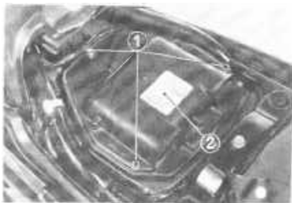
(1) Parafusos (2) Tampa do filtro de ar