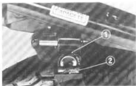
(1) Suporte do capacete (2) Chave de ignição

Sua motocicleta está equipada com dois suportes para capacete (1), colocados nas laterais da motocicleta, abaixo do assento. Introduza a chave de ignição (2) no suporte e gire-a no sentido anti-horário para abrir a trava. Coloque seu capacete no suporte e pressione o pino de fixação (3) para prendê-lo.